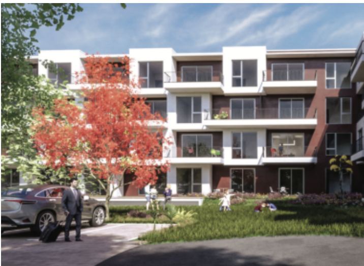
CENTURION RESIDENCES 1.KAT - segment 1